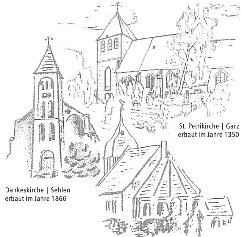
St. Petrikerche | Garz erbaut im Jahre 1350