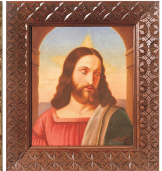
Christusbild, C. Thomas 1899

Hinweise auf den/die Täter beziehungsweise auf das Diebesgut nehmen Beamte des Polizeihauptreviers Bergen oder Pastor Giesecke (Tel. 038304/257) entgegen